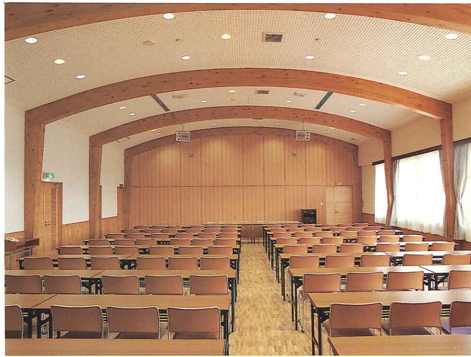
●多目的ホール アーチ形集成梁による大空間 スギの壁面(正面)とアテの腰板