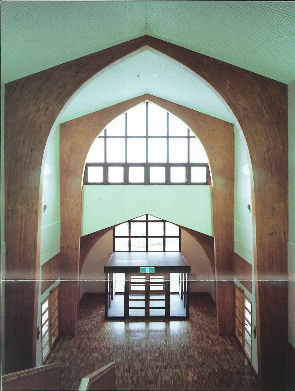
●ホワイエ 山形ラーメン工法による吹抜け空間とアテのサッシ