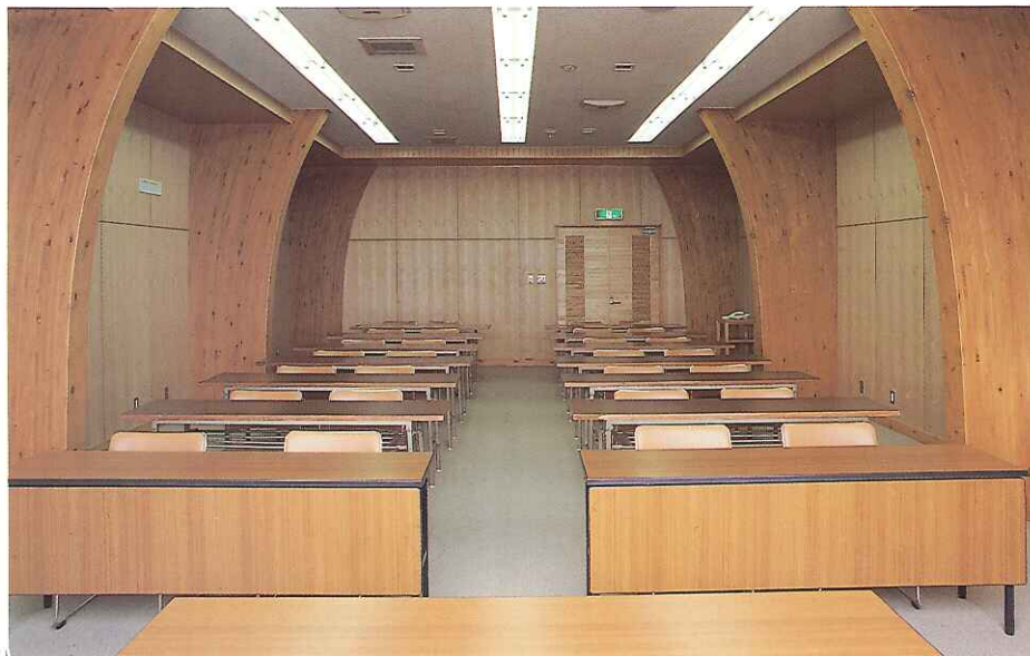
●研修室 木に包まれ落ち着いた雰囲気の内

〔建物の特徴〕 湾曲大断面集成材と、在来軸組木構造を混交した近代的な切り妻屋根の木構造建築である。 建物は中央部の山形ラーメン工法と、その両側のアーチ形工法を一体化した大断面集成材を主要構造とし、外部窓の木製サッシ、階段の梁や板等に集成材を使っている。 これらの木材は県内産のあて、あかまつ、すぎを使っており、建物自体が、木の良さや県産材の新しい使い方を理解してもらう展示品である。