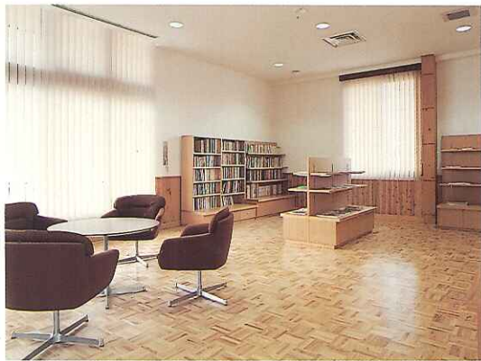
●情報相談コーナー 大断面集成材工法の採用による 明るい室内