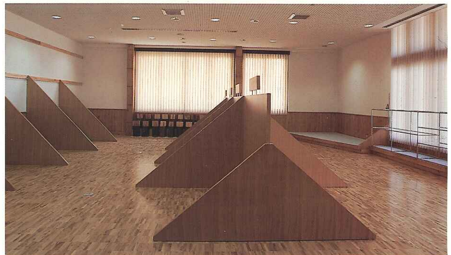
●展示ホール アテの腰板とサクラの床、白山天然スギの展示棚