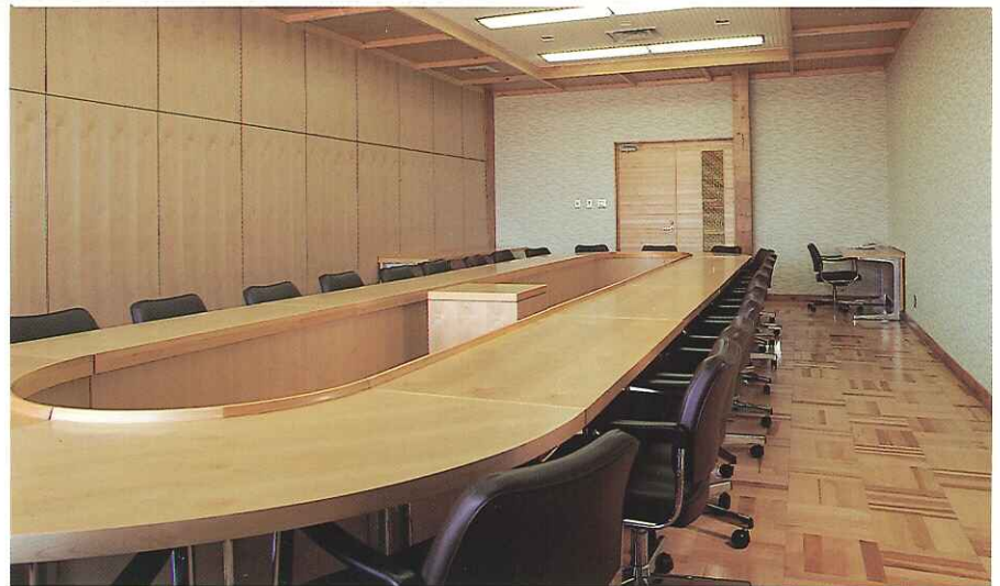
●会議室 美しいアテの壁面 (左側)