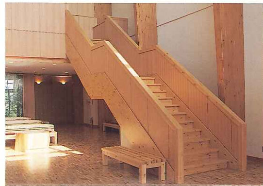
●2点湾曲集成梁による 無支柱階段

〔建物の特徴〕 湾曲大断面集成材と、在来軸組木構造を混交した近代的な切り妻屋根の木構造建築である。 建物は中央部の山形ラーメン工法と、その両側のアーチ形工法を一体化した大断面集成材を主要構造とし、外部窓の木製サッシ、階段の梁や板等に集成材を使っている。 これらの木材は県内産のあて、あかまつ、すぎを使っており、建物自体が、木の良さや県産材の新しい使い方を理解してもらう展示品である。